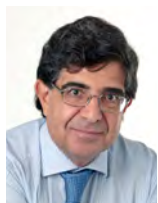
Antonio Penteadó Mendonça Presidente da Academia Paulista de Letras

Assim, a Academia Paulista de Letras cumpre seu papel institucional e dessa forma contribui para o desenvolvimento da cultura e da literatura no Estado de São Paulo.