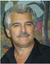
Primeiro lugar As meninas da Arnaldo / Antônio Carlos Tórtoro – Clube de Regatas Ribeirão Preto